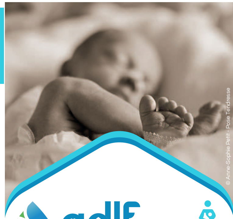
© Anne-Sophie Petit - Pose Tendresse